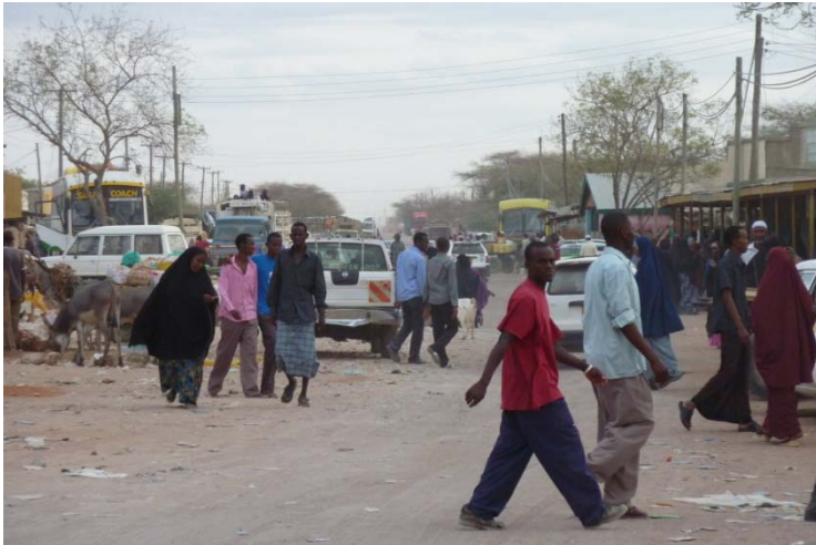
Wajir centrum, Schoon is de stad nog niet, maar de eerste schreden worden gezet.

Zo is de algemene praktijk van vrouwenbesnijdenis verminderd en krijgen vrouwen steeds meer een gelijkwaardige plek in de samenleving. Onderwerpen als Hiv en drugs zijn bespreekbaar en er worden allerlei initiatieven ontplooid op gebied van milieu, landbouw, gezondheidszorg en zorg voor bejaarden. Dat laatste is heel bijzonder want in het nomadenbestaan kunnen gebrekkige ouderen onmogelijk meetrokken en worden vaak eenzaam achter gelaten om te sterven in de bush. Ook bijzonder is dat er steeds meer aan herbebossing en landbouw wordt gedaan, want de nomadische veehouders kijken met minachting neer op de landbouw – terwijl herbebossing en landbouw effectieve middelen zijn tegen droogte en honger. En de rotzooi wordt opgeruimd. Overal in Wajir staan vuilnisbakken en steeds meer mensen mikken hun troep erin.