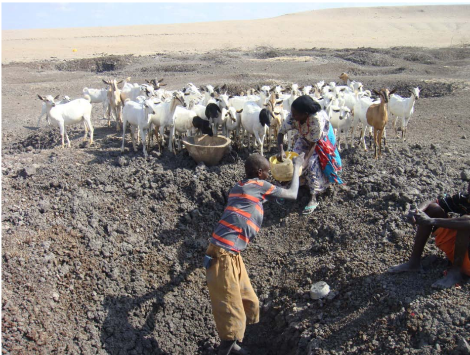
Een jonge herder haalt het laatste beetje water uit een put op de bodem van een drooggevalen meer.