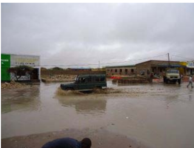
Wajir na een buitje op 13 oktober

Inmiddels heeft het, na drie jaar van extreme droogte, geregend in Wajir. Niet een beetje, maar ongelooflijk hard. De droge grond kan het water niet bevatten en complete rivieren spoelen alle rotzooi door de straten. Het water spoelt ook de waterputten in, die erdoor verontreinigen met alle risico's vandien. 't Is hollen of stilstaan in de Hoorn van Afrika en het is duidelijk dat er wat moet veranderen.