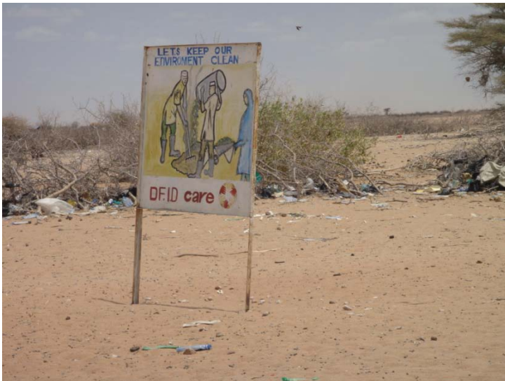
let's keep the enviroment clean....