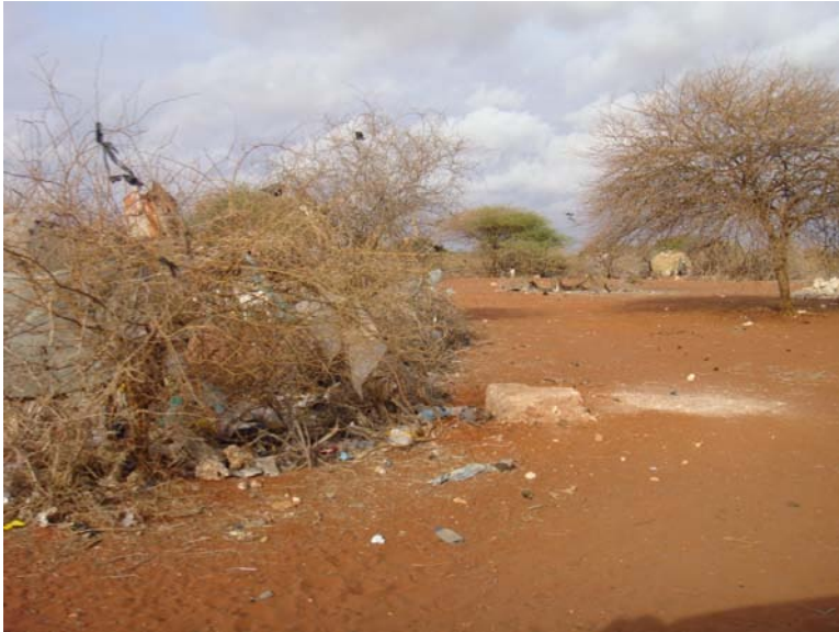
Aan de struiken zit meer plastic dan groen blad.

In tijden van droogte, zie je alleen maar stof, veel stof, heel veel grijze stof. Wat misschien ooit een mooi landschap moet zijn geweest met groene struikjes en boompjes is nu, na drie jaar extreme droogte, niet meer dan een grauwe, grijze, stoffige en vooral vieze vlakte. Vies, want nog meer dan het stof valt het alom aanwezige plastic op. Overall ligt plastic en naarmate je dichterbij een bewoond gebied komt, ligt er meer.