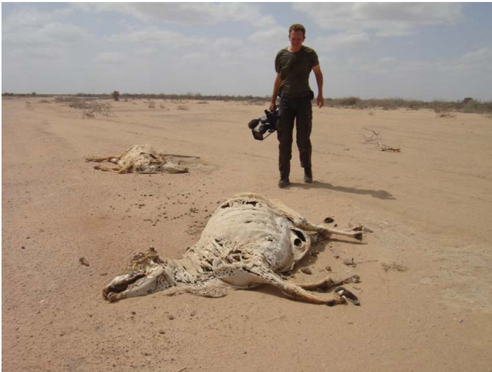
overal ligt gestorven vee

Totdat de droogte toeslaat, zoals dat vaak gebeurt als La Niña langskomt. Dat weerfenomeen zorgt er om de zoveel jaar voor dat Oost Afrika in de doorgaans natte oktober tot en met decembermaanden droog is. In dergelijke droge periodes sterft een deel van het vee – of soms zelfs bijna al het vee zoals nu. Komt er weer regen, dan breidt de veestapel zich weer uit en begint de cyclus opnieuw. Eeuwenlang ging het zo en waren de boeren redelijk bestand tegen de cycli van voor- en tegenspoed, maar het veranderende klimaat heeft daar een einde aan gemaakt. De huidige droogte duurt nu al jaren en de Hoorn van Afrika is compleet uitgedroogd. Het is de ergste droogte sinds 60 jaar. Het vee sterft en de mensen trekken naar plekken waar water en voedsel is – als ze die al weten te bereiken en onderweg niet sterven zoals nu in ongelooflijke aantallen het geval is.